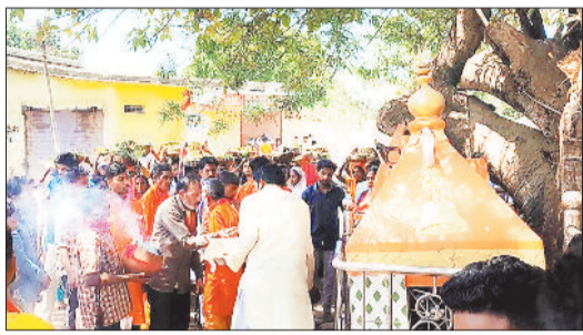
पूजा-अर्चना के लिए लगी भीड़।