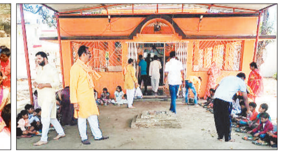
मंदिर प्रांगण में आयोजित कन्या भोज।