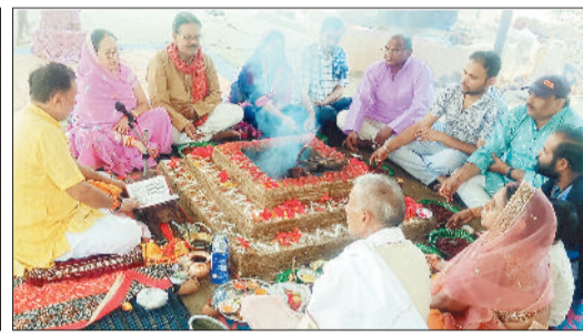
प्रेमाबाग में हवन-पूजन करते श्रद्धालु।