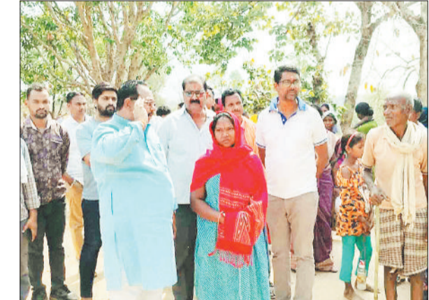
मृतक के परिजन व ग्रामीणों से चर्चा करते विधायक।