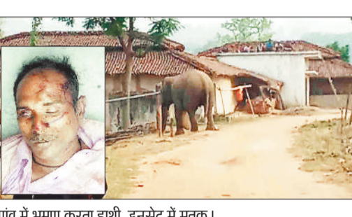
गाँव में भ्रमण करता हाथी, इनसेट में मृतक।