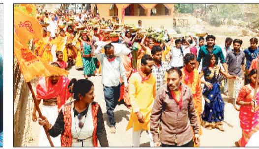
ओड़गीनाका में निकली ज्वारा विसर्जन यात्रा।